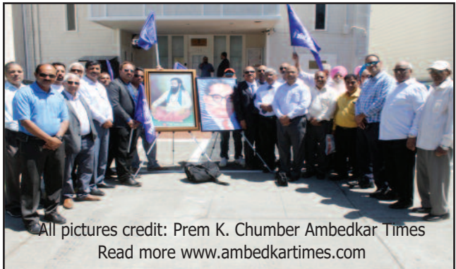
ਸੁਪਰੀਮ ਕੋਰਟ ਸ੍ਰੀ ਗੁਰੂ ਰਵਿਦਾਸ ਸਭਾ ਯੂ. ਐਸ. ਏ. ਅਤੇ ਹੋਰ ਸ੍ਰੀ ਗੁਰੂ ਰਵਿਦਾਸ ਸਭਾਵਾਂ ਅਤੇ ਡਾ. ਅੰਬੇਡਕਰ ਸਭਾਵਾਂ, ਦੇ ਸਭਾਵਾਂ ਦੇ ਨੁਮਾਇੰਦੇ ਨਵੀਂ ਦਿੱਲੀ ਸਥਿਤ ਇਤਿਹਾਸਕ ਮੰਦਰ ਸ੍ਰੀ ਗੁਰੂ ਰਵਿਦਾਸ ਟੈਂਪਲ ਤੁਗਲਕਾਬਾਦ ਨੂੰ ਢਾਹੇ ਜਾਣ ਪ੍ਰਤੀ ਰੋਸ ਪ੍ਰਗਟ ਕਰਦਿਆਂ ਕੌਲ ਜਨਰਲ ਆਫਿਸ, ਸੈਨਫਰਾਂਸਿਸਕੋ (ਕੈਲੀਫੋਰਨੀਆ) ਦੇ ਅਧਿਕਾਰੀ ਨੂੰ ਮੈਮੋਰੈਂਡਮ ਦਿੰਦੇ ਹੋਏ। (ਵਿਸਥਾਰਿਤ ਰਿਪੋਰਟ ਅਤੇ ਤਸਵੀਰਾਂ ਦੇਖੋ ਸਫ਼ਾ 12, 13 'ਤੇ)