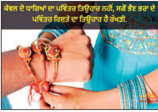
ਕੇਵਲ ਦੋ ਧਾਗਿਆਂ ਦਾ ਪਵਿੱਤਰ ਤਿਉਹਾਰ ਨਹੀਂ, ਸਗੋਂ ਭੈਣ ਭਰਾ ਦੇ ਪਵਿੱਤਰ ਰਿਸ਼ਤੇ ਦਾ ਤਿਉਹਾਰ ਹੈ ਰੱਖੜੀ.