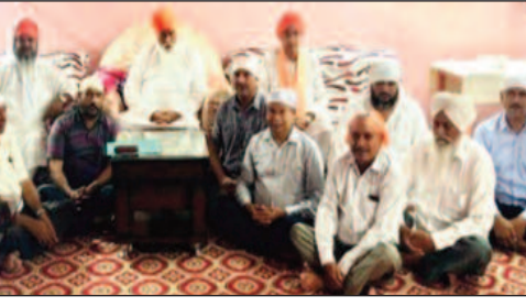
ਦਾਹੁਣ 'ਤੇ ਡੂੰਘਾ ਅਫਸੋਸ ਪ੍ਰਗਟ ਕੀਤਾ ਗਿਆ। ਮੀਟਿੰਗ 'ਚ ਉਨ੍ਹਾਂ ਨੇ ਕਿਹਾ ਉਨ੍ਹਾਂ ਵੱਲੋਂ ਰਾਸ਼ਟਰਪਤੀ, ਪ੍ਰਧਾਨ ਮੰਤਰੀ