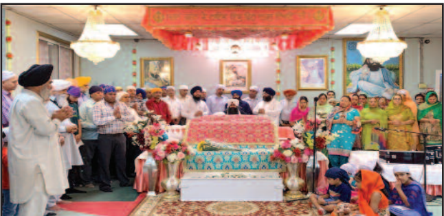
ਸ੍ਰੀ ਗੁਰੂ ਰਵਿਦਾਸ ਟੈਂਪਲ, ਰਿਚਿ ਲਿੰਡਾ, ਦੀ ਪ੍ਰਬੰਧਕ ਕਮੇਟੀ ਵਲੋਂ ਤੁਗਲਕਾਬਾਦ (ਦਿੱਲੀ) ਸਥਿਤ ਇਤਿਹਾਸਕ ਮੰਦਰ ਤੋਂ ਜਾਣ ਤੇ ਸਖ਼ਤ ਰੋਸ ਪ੍ਰਗਟ ਕੀਤਾ ਗਿਆ। (ਰਿਪੋਰਟ ਦੇਖੋ ਸਫ਼ਾ 9 'ਤੇ)

ਮੁੱਖ ਸੰਪਾਦਕ : ਪ੍ਰੇਮ ਕੁਮਾਰ ਚੰਬਰ ਸੰਪਰਕ : 916-947-8920 ਫੈਕਸ : 916-238-1393 E-mail : deshdoaba@yahoo.com ਸੰਪਾਦਕ : ਤਰਸੇਮ ਜਲੰਧਰੀ